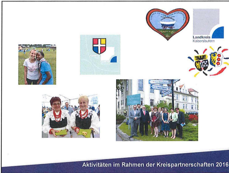
Aktivitäten im Rahmen der Kreispartnerschaften 2016