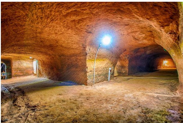
Bierkeller Schönenberg-Kübelberg

Die Bierkeller liegen auf einer Route (Ritter Gerin Weg) des begehrbaren Geschichtsbuchs, welches auch über eine LEADER-Förderung der LAG Westrich-Glantal entwickelt wurde. Somit stärkt dieses Projekt auch bereit bestehende touristische Strukturen der Region.