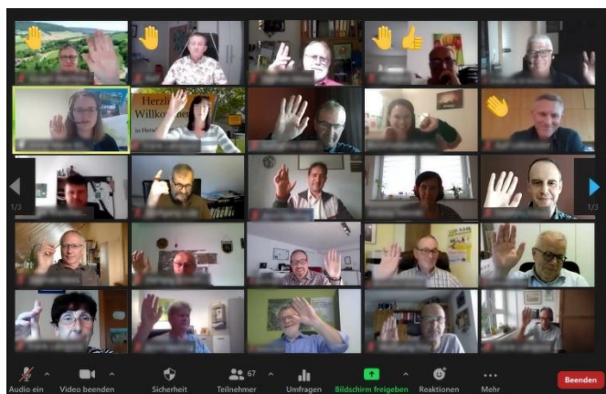
LILE Auftaktveranstaltung am 24.06.2021